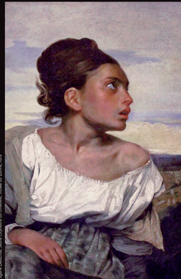
Eugène Delacroix, Jeanne Ophélie au miroir, musée du Louvre, Paris